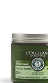
Шашқа арналған L'OCCITANE қоректік маскасы