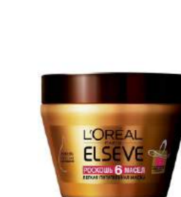
Шашқа арналған Elseve маскасы BEAUTYMANIA дүкенінде