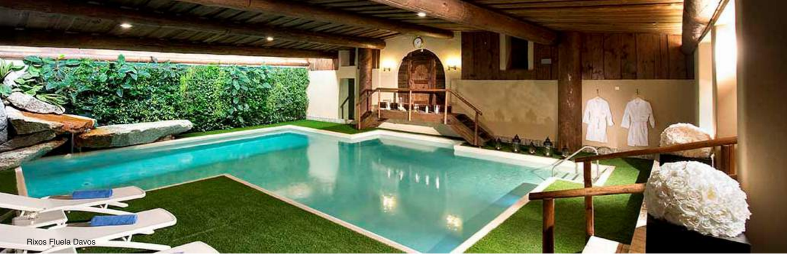
Rixos Fluela Davos

Любителям велосипедных прогулок в Давосе тоже найдется развлечение — фэтбайкинг — катание на горных велосипедах. Четыре впечатляющих велосипедных спуска ждут вас на горе Пиша.