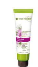
Шашты көлемді ететін құлқайыр қосылған шайқауыш бальзамы YVES ROCHER дүкенінде