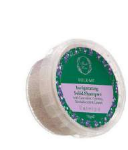
Жұқа әрі әлсіз шашқа арналған «Эфтерпия» сусабыны FRESH LINE дүкенінде