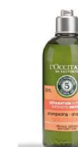
Қалпына келтіргіш L'OCCITANE сусабыны