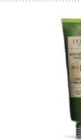
Интенсивті «Минутка» күтім кремі L'OCCITANE дүкенінде