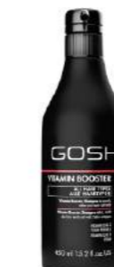
Қалпына келтіретін Vitamin Booster сусабыны MON AMIE дүкенінде