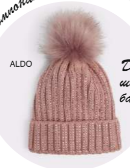
Манса с поттонали