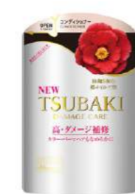
Зақымдалған шашты қайта қалпына келтіруге арналған Tsubaki Damage Care кондиционері MON AMIE дүкенінде