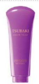
Шашқа көлем беретін Tsubaki Volume Touch бальзамы MON AMIE дүкенінде