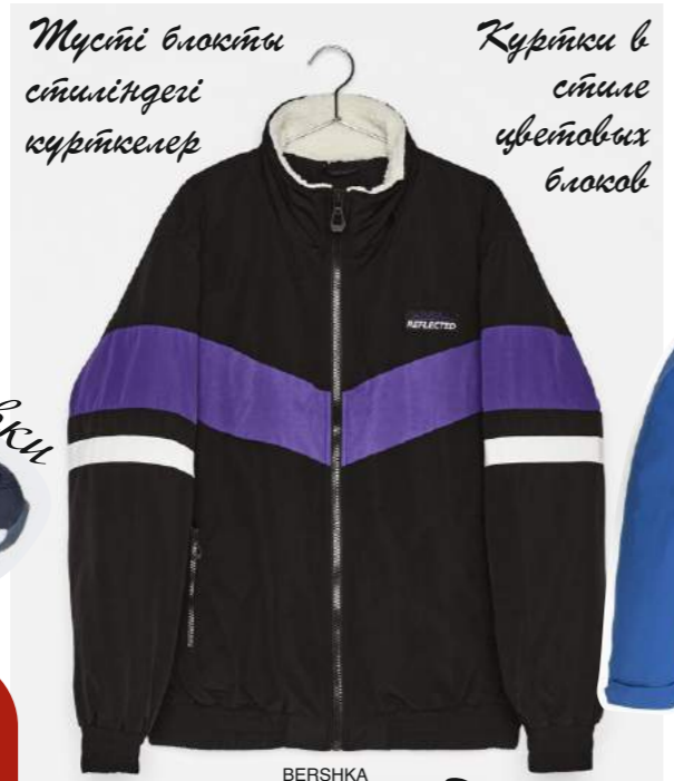
Түсті блоқты стиліндегі курткалар