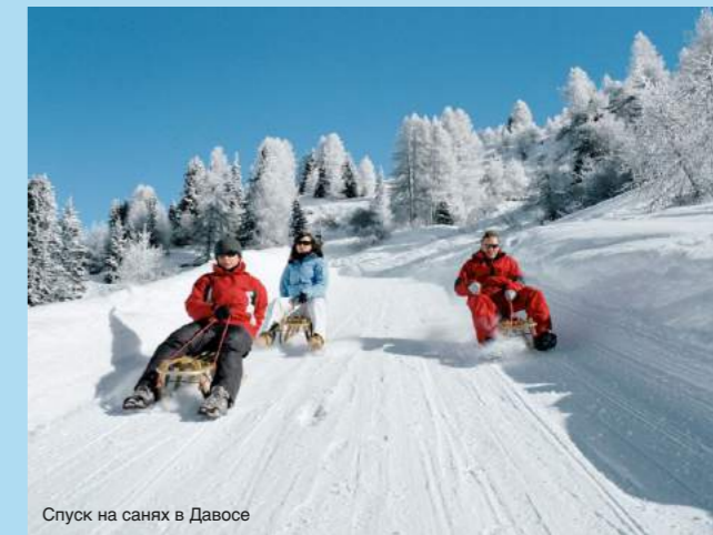
Спуск на санях в Давосе