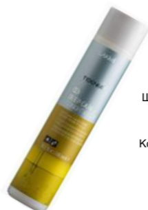
Шашқа арналған Lakme Teknia Deep Care кондиционері BEAUTYMANIA дүкенінде Кондиционер для волос Lakme Teknia Deep Care в BEAUTYMANIA