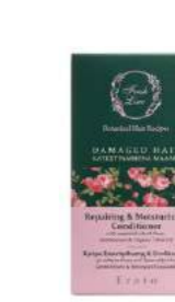
Құрғақ әрі зақымдалған шашқа арналған «Эрато» кондиционері FRESH LINE дүкенінде