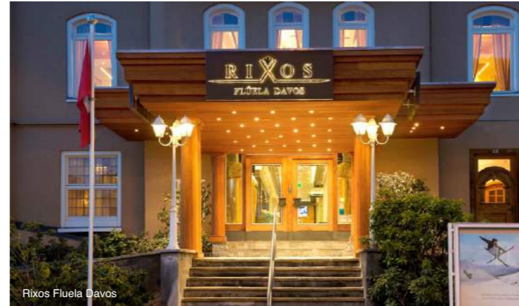
Rixos Fluela Davos