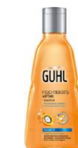
Ылғандырғыш Guhl сусабыны INTERFOOD дүкенінде