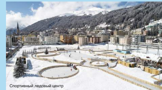
Спортивный ледовый центр

Давоста отбасыңызбен бірге келіп тоқтайтын бірден-бір жер — Rixos Fluela Davos қонақүйі. Давостың орталығында без жұлдызды қонақүйі Парсеннбах арқанжолынан бірнеше метр жерде орналасқан және альпалық керемет панорамасына керемет көрінісін көре аласыздар. Сіздерге арнап оңалту кешенінде: сауна, джакузи, шабыну бөлмесі, жүзу бассейні мен фитнес-залдар бар. Салтанатты және заманауи қызмет көрсетілетін жайлы бөлмелер, таңдаулы тағамдарымен ресторандар және бар отбасыңызға керемет көңіл күй сыйлайды. Rixos Fluela Davos — ең әйгілі тау шаңғы шипажайында орналасқан заманауи қонақүйінде сіз отбасыңызбен қысқы демалыстарыңызды жайлы өткізесіз.