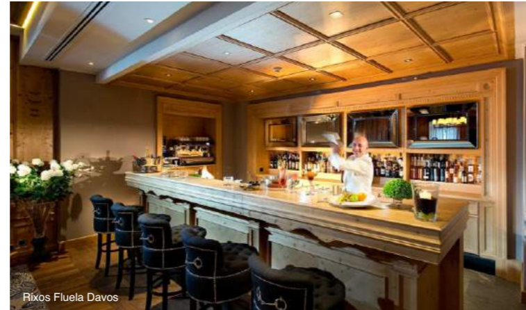
Rixos Fluela Davos

Лучший выбор для проживания с семьей в Давосе — отель Rixos Fluela Davos . Пятизвездочный отель в центре Давоса находится всего в нескольких метрах от канатной дороги Парсеннбах и открывает вид на прекрасную альпийскую панораму. К вашим услугам оздоровительный центр с сауной, джакузи, парилкой, плавательным бассейном и фитнес-залом. Роскошные и комфортные номера с современным сервисом, рестораны и бар с изысканной мировой кухней создадут прекрасное настроение для всей семьи. Rixos Fluela Davos — современный отель на самом знаменитом горнолыжном курорте мира, где вы погрузитесь в комфортный отдых и получите удовольствие от зимнего уютного времяпрепровождения с семьей.