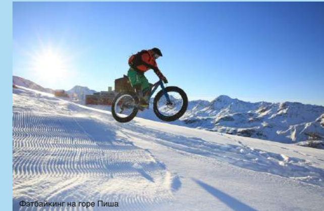
Фэтбайкинг на горе Пиша