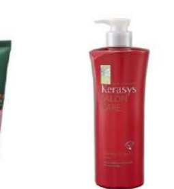
Шашқа арналған KeraSys Voluming Ampoule Rinse кондиционері INTERFOOD дүкенінде