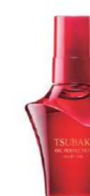
Мінсіз шашқа арналған Tsubaki Extra Moist майы MON AMIE дүкенінде