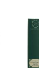
«Полимния» шаш түсуіне қарсы FRESH LINE дүкенінде