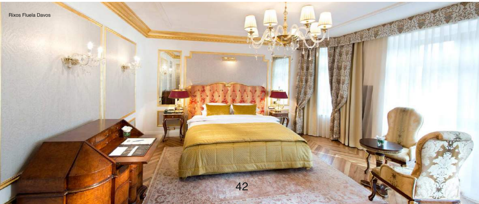
Rixos Fluela Davos