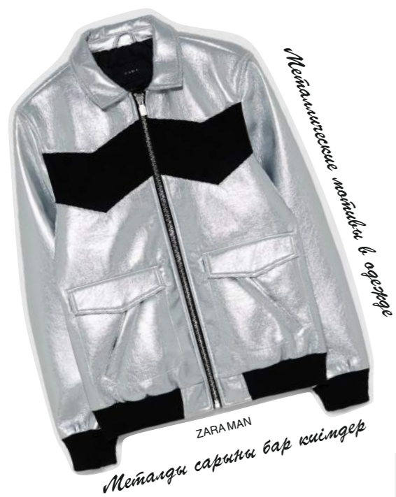
Металликте маймыл в аффорде