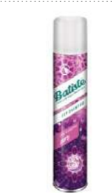
Batiste Party құрғақ сусабыны BEAUTYMANIA дүкенінде