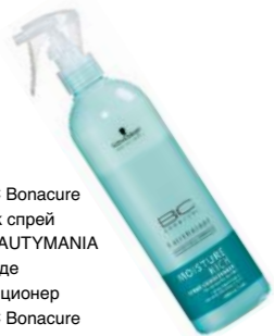
Schwarzkopf BC Bonacure Moisture Kick спрей кондиционері BEAUTYMANIA дүкенінде Спрей-кондиционер Schwarzkopf BC Bonacure Moisture Kick в BEAUTYMANIA