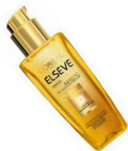
Elseve шашқа арналған жақла майы BEAUTYMANIA дүкенінде Масло для волос Elseve в BEAUTYMANIA