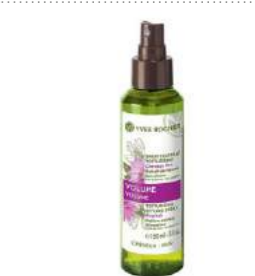
Шашты сәндеуге әрі көлем беруге арналған құлқайыр қосылған YVES ROCHER спрейі